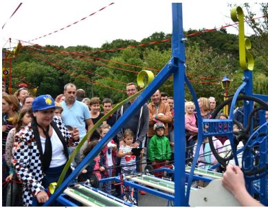
12 postes de jeu simultanés

Les jeux proposés au public sont mécaniques et visuels et nécessitent pour la plupart dextérité et sens de l'humour. Les structures sont, soit décorées de publicités peintes vantant les attractions, soit traitées de manière à laisser apparaître les mécanismes. Afin de créer du lien, les différents jeux ne fonctionnent qu'avec la participation de plusieurs personnes, soit pour l'esprit même du jeu, soit pour l'encouragement de ses participants, ou simplement pour en assurer son fonctionnement.